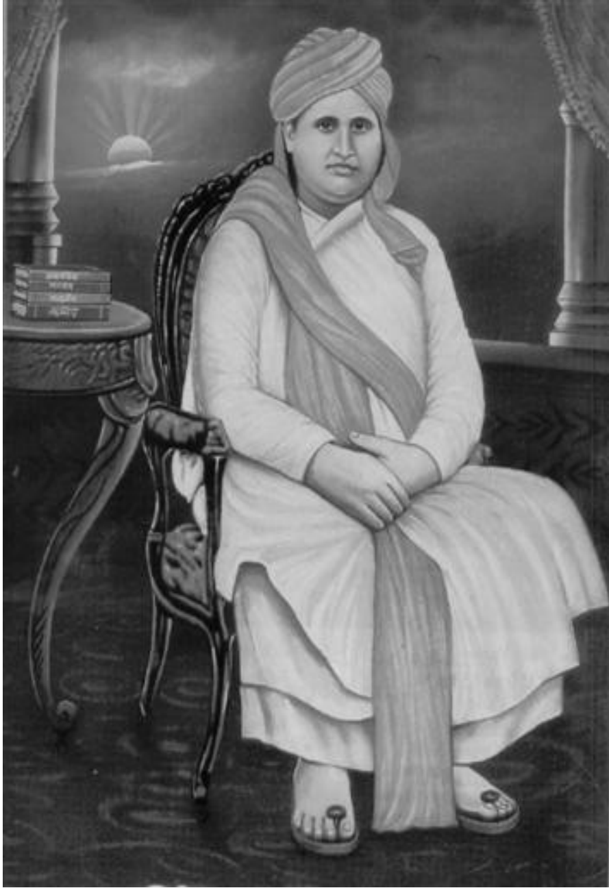
Swami Dajanand Saraswati