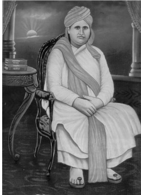
Swami Dajanand Saraswati Reformator der Wedischen Hindu-)Religion